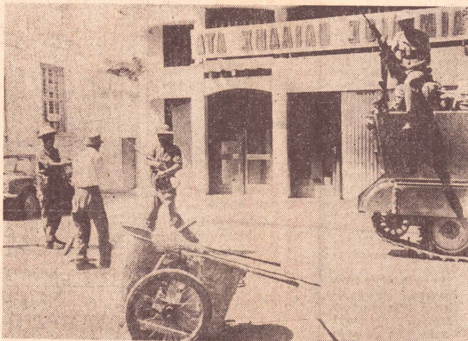
KYRENIA, Chipre, Agosto. Un obrero de limpieza de calles en Kyrenia es interrumpido ayer en su trabajo por soldados turcos armados que ocupan la población pese al acuerdo de paz.